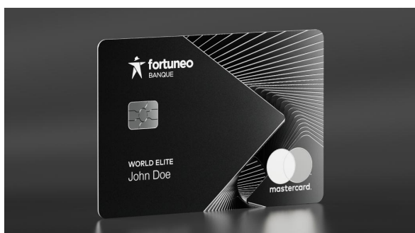
Carte World Elite CB Mastercard