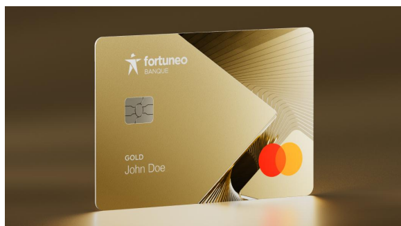
Carte Gold CB Mastercard